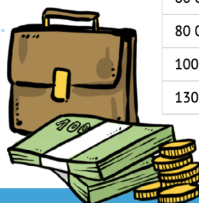
Efekt navrhovaných opatření na výpočet čisté mzdy